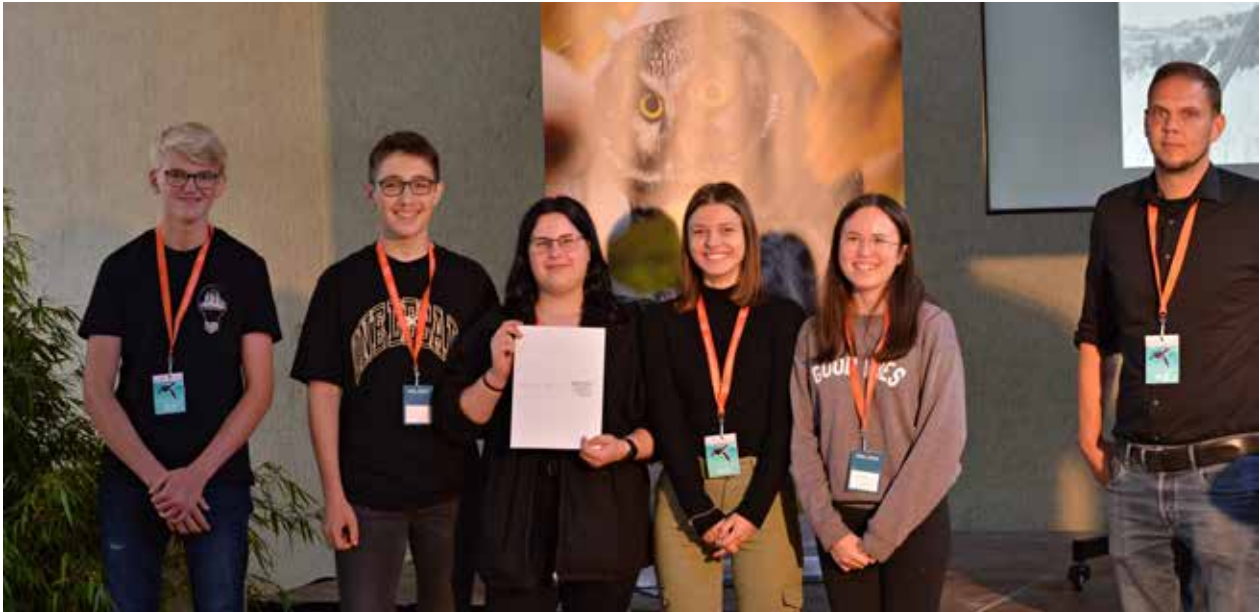
Die Schüler-AG aus Gieboldehausen bei der Preisverleihung in Eckernförde