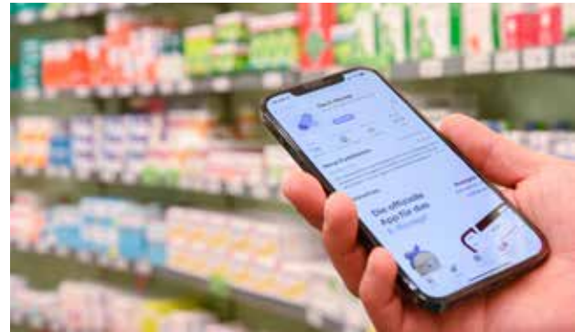
E-Rezept-App auf dem Smartphone

Krankenkasse. Übrigens: Internetempfang brauchen Sie in der Apotheke nicht, um das E-Rezept per Smartphone einlösen zu können. Einmal heruntergeladen stehen die E-Rezepte in der App auch offline zur Verfügung.