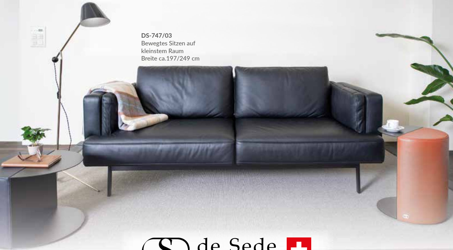
DS-747/03 Bewegtes Sitzen auf kleinstem Raum Breite ca.197/249 cm