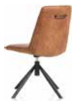
Stuhl Brody 249,-