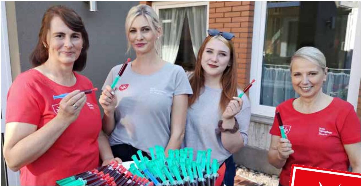
Begrüßung der Teilnehmer zur Nacht der Pflege mit einer Vitaminspritze durch Mitarbeiter der Malteser