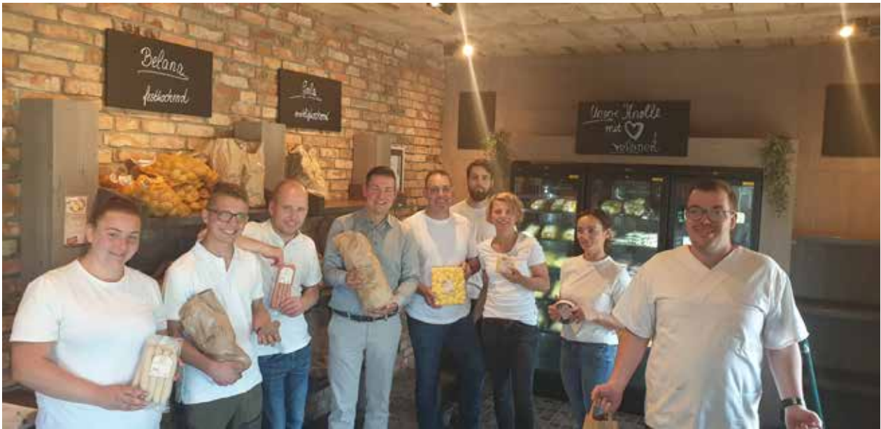
Familienbetrieb mit acht Mitarbeiterinnen und Mitarbeitern in unserem Hofladen