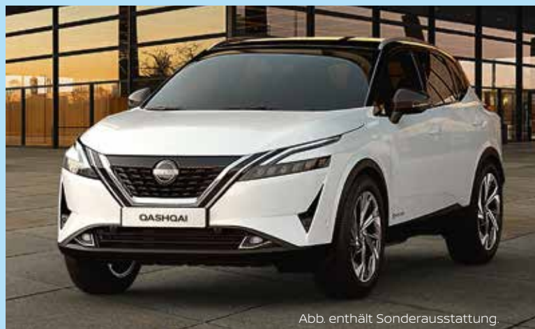
Abb. enthält Sonderausstattung.

Kraftstoffverbrauch in l/100 km (WLTP): Kurzstrecke 5,3 - 5,1; Stadtrand 4,6 - 4,4; Landstraße 4,7; Autobahn 6,6 - 6,5; kombiniert 5,4 - 5,3. CO2 Emission kombiniert in g/km (WLTP): 122 - 120.