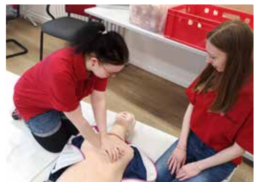
Malteserschüler zeigen Techniken zur Ersten-Hilfe

Mehr Infos zur Pflegeausbildung gibt es bei https://www.malteser-duderstadt.de/ .