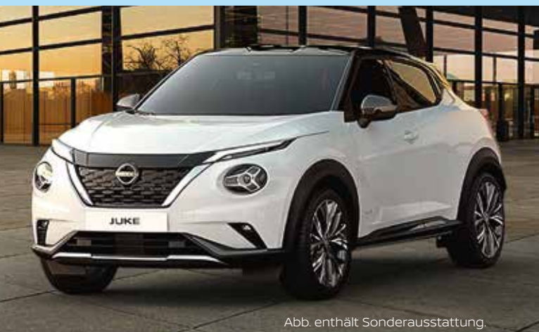
Abb. enthält Sonderausstattung.

Kraftstoffverbrauch in l/100 km (WLTP): Kurzstrecke 4,9 - 4,8; Stadtrand 4,3; Landstraße 4,4; Autobahn 5,9 - 5,8; kombiniert 5,0 - 4,9. CO2 Emission kombiniert in g/km (WLTP): 113 - 111.