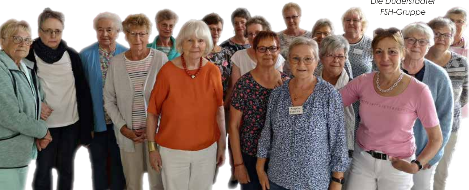
Die Duderstädter FSH-Gruppe

Manche, die heute dabei sind, hatten schon vor 20 oder 30 Jahren ihre Krebsdiagnose bekommen. Das trotzdem ein langes Leben möglich ist und die medizinischen Fortschritte sich stetig weiterentwickeln, macht vielen Betroffenen Mut. „Wir haben alle ähnliche Erfahrungen, aber jeder Krankheitsverlauf ist sehr individuell. Manche Frauen haben viele Fragen und suchen den Austausch, andere brauchen