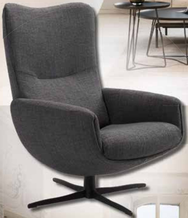
Jori Time Out Sessel in Stoff ab 3576,-€