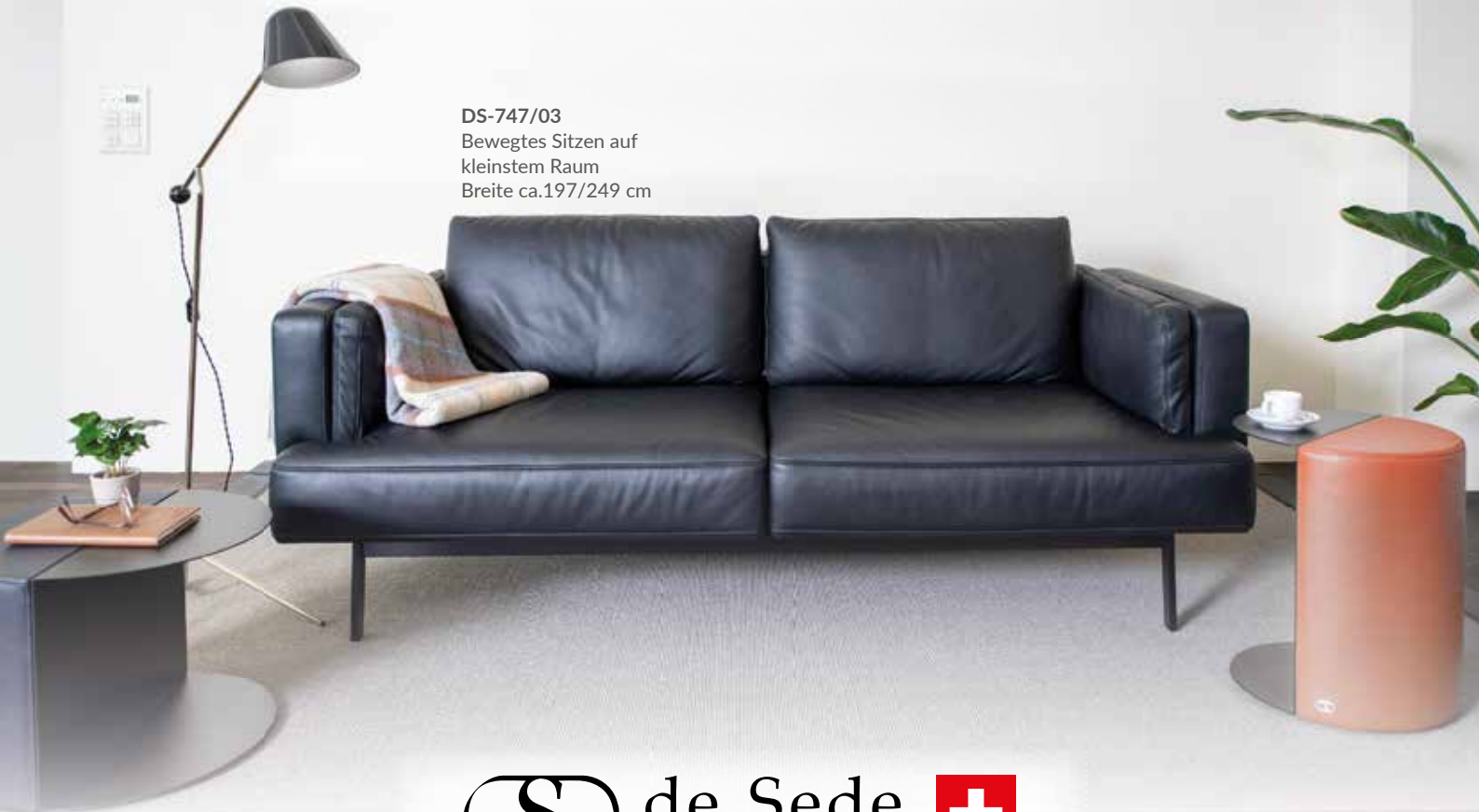
DS-747/03 Bewegtes Sitzen auf kleinstem Raum Breite ca.197/249 cm