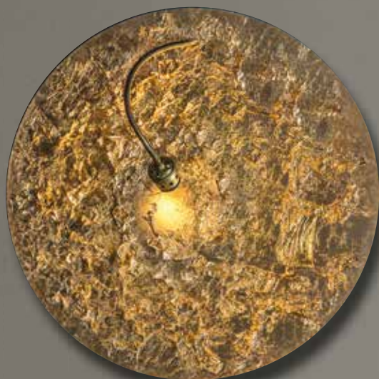
Wandleuchte Luna Piena blattsilber/blattgold, D: 80cm, LED 1x7,5 Watt, dimmbar