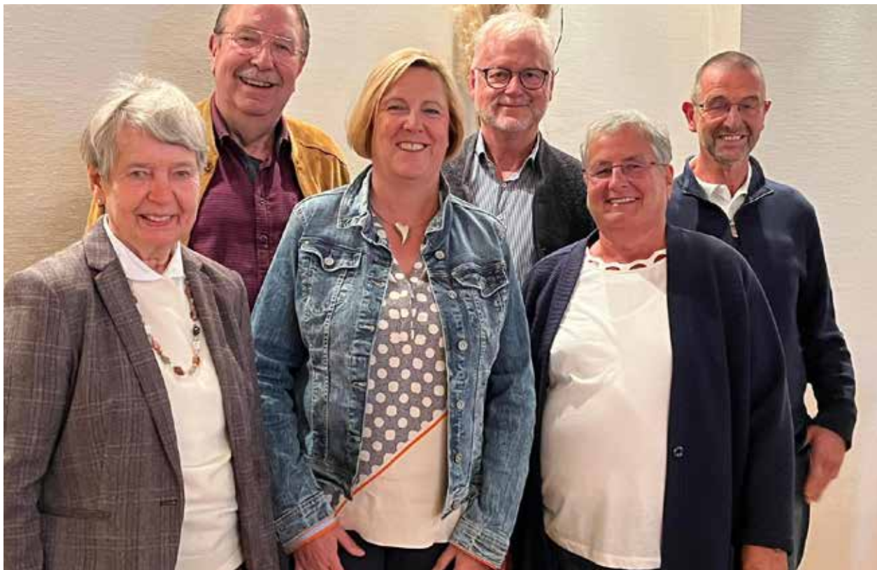
Der Vorstand der Bürgerstiftung auf ihrer Jahreshauptversammlung im September 2022

Bürgerstiftung Ambulantes und Stationäres Hospiz Hann. Münden e.V.