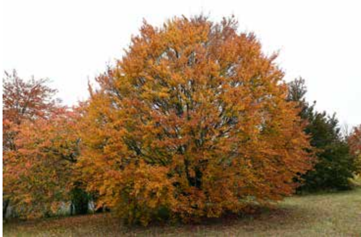
Hat unter den trockenen Sommern der vergangenen Jahre überraschend stark gelitten: Die Rot-Buche, der «Baum des Jahres» 2022.

M anche Namen verwirren: Die Rotbuche verfärbt im Herbst ihre Blätter gar nicht rot, sondern leuchtend orange. Fehlt ausreichend Frost sogar nur gelblich. Aber wenn man sie genau anschaut, erkennt man den Grund für die Namensgebung: Ihr Holz ist leicht rot gefärbt.