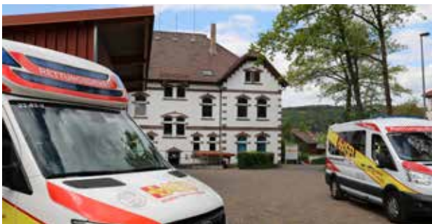
Direkt vor Ort: Am Kattenbühl 12 in Hann. Münden ist die Zentrale des ASB-Kreisverbands Göttingen-Land.

„Wir helfen hier und jetzt“, ist das Motto des Arbeiter-Samariter-Bund Kreisverbands Göttingen-Land mit Hauptsitz im Hann. Münden am Kattenbühl 12. Der ASB ist eine Hilfsorganisation mit vielen Angeboten. Dazu zählen Rettungsdienst, Krankentransport und Sanitätsdienst, aber auch das Corona-Testzentrum am Bahnhof in Münden, das Schnelltests und PCR-Tests durchführt. Zudem werden Erste-Hilfe-Kurse angeboten. Für Senioren sind die Tagespflegen in Hann. Münden, Lutterberg und Dransfeld interessant oder der Hausnotruf kreisweit. Die Kindertagesstätte mit der Kinderkrippe in Lutterberg ist für die Jüngsten da. Außerdem ist das Ehrenamt vertreten mit der Arbeiter-Samariter-Jugend, der Schnell-Einsatz-Gruppe sowie FSJ- und BFD-Stellen. Wer mehr über den ASB wissen möchte, geht ins Internet ( www.asb-muenden.de ) oder ruft an (05541 / 90 52-0).