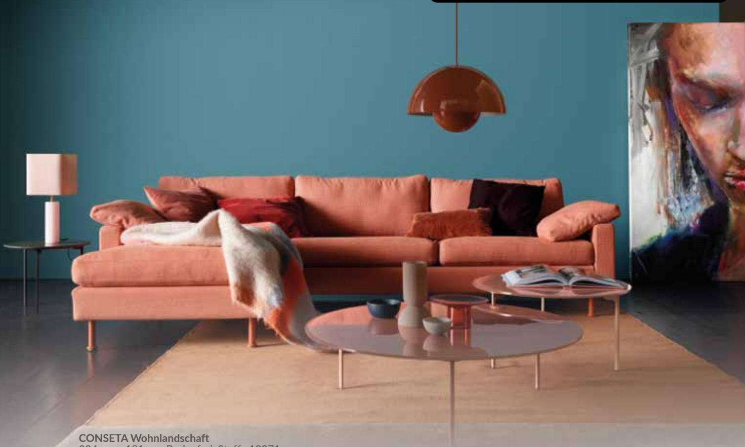
CONSETA Wohnlandschaft 294 cm x 181 cm, Bodenfrei, Stoff: 10071 Grapefruit Dieses neue Liegeelement mit 120 cm Kissenbreite ist der beste Platz, um mit Lieblingsmenschen bequem zu lümmeln und zu fläzen.