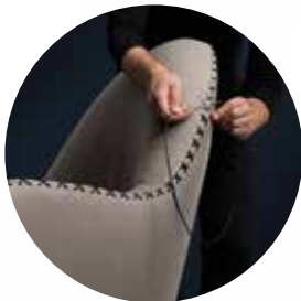
DS-102/11 Sessel DS-102/05 Hocker Eine Serie mit auffälliger Kernschnürung