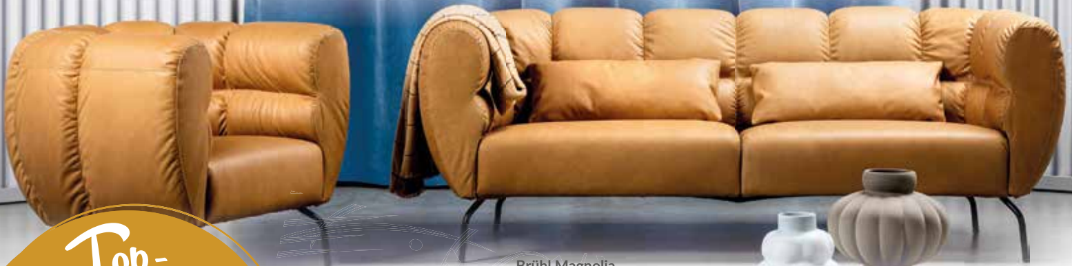
Brühl Magnolia Sofa + Sessel Reddot Winner 2022